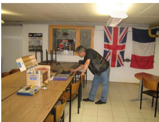
Vorbereitungen am frühen Morgen