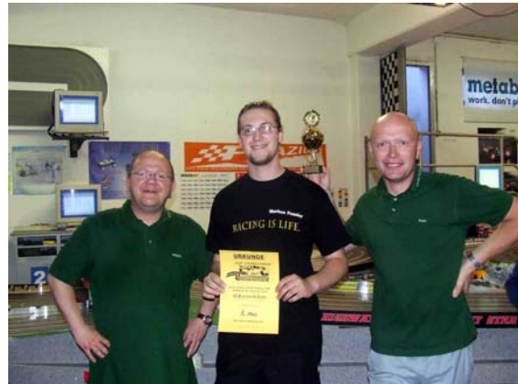
Gute Laune angeboren: Slot Mittelrhein auf Platz 5