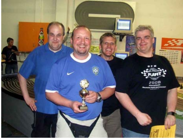
Platz 4 für Racing is Life